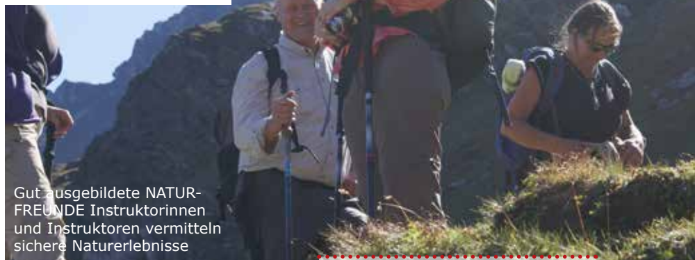
Gut ausgebildete NATURFREUNDE Instruktorinnen und Instruktoressen vermitteln sichere Naturerlebnisse